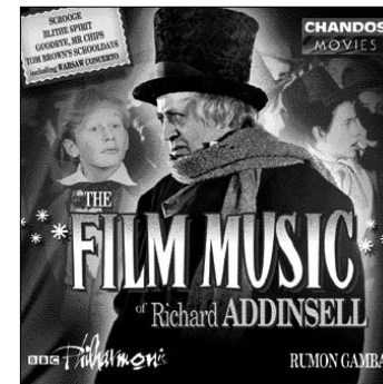
The Film Music of Richard Addinsell CHAN 10046