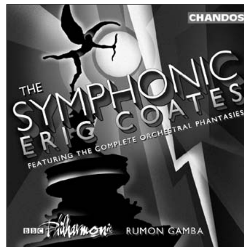
The Symphonic Eric Coates CHAN 9869