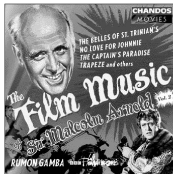
The Film Music of Sir Malcolm Arnold, Volume 2 CHAN 9851