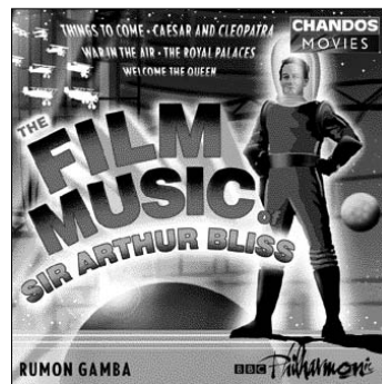
The Film Music of Sir Arthur Bliss CHAN 9896